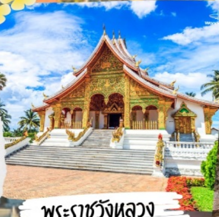
พระราชวังหลวง