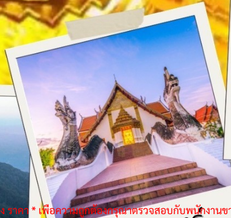
จตุภินทร