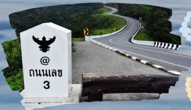
ถนนหมายเลข 3