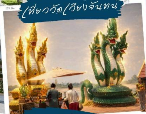
ขอพรวัดหนองคาย