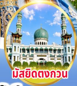
มัสยิดตงกอน