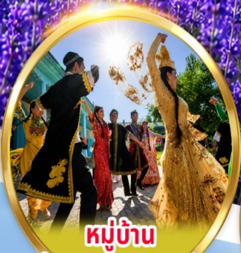
หมู่บ้าน วัฒนธรรมอุยกูร์

พิเศษ นั่งรถม้า + ซิมไอศกรีมอุยกูร์ ชมการแสดง