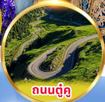
ถนนตุ๋นคู