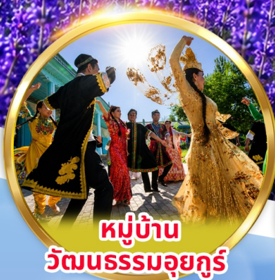
หมู่บ้าน วัฒนธรรมอูยกูร์

พิเศษ นั่งรถม้า + ชิมไอศกรีมอูยกูร์ ชมการแสดง