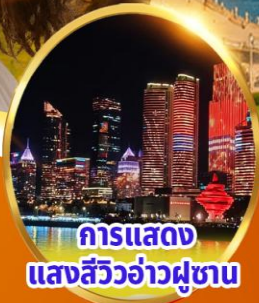
การแสดง แสงสีว้าวคู่ขนาน