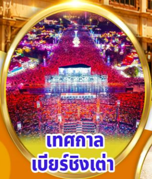
เทศกาล เบียร์ชิงเต่า