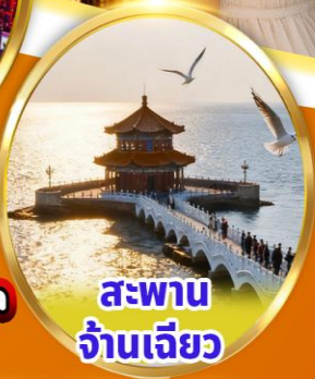
สะพาน จ้านเจียว