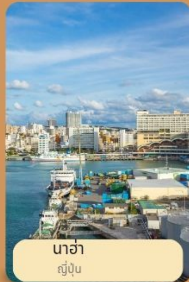
นาฮา ญี่ปุ่น