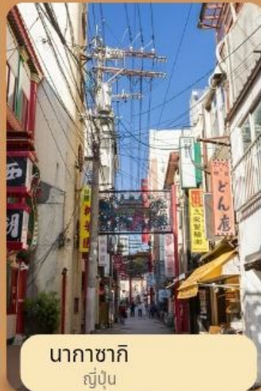
นากาซากิ ญี่ปุ่น