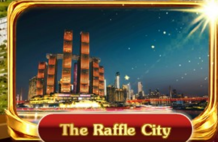
The Raffle City