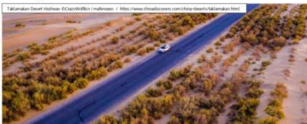
Taklamakan Desert Highway

ทางหลวงสายที่ 3 - ทางหลวงสายสาขา เปิดล่าสุดเมื่อ 30 มิ.ย. พ.ศ. 2565 มีความยาว 334 กม. ทางหลวงแห่งนี้คือ Yuli-Qiemo Highway crossing the Taklamakan Desert เชื่อมเมืองยูลี Yuli County กับ เมืองเฉียนโม Qiemo County ของเขตปกครองตนเองปาอินโกลิมนมองโกเลีย Bayingolin Mongolian Autonomous Prefecture