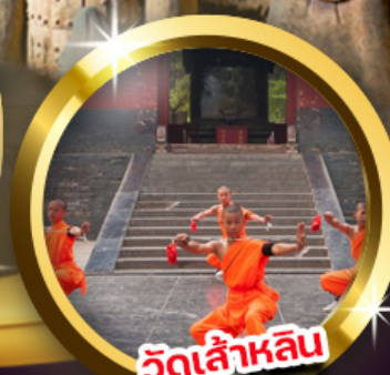
วัดเล่าหลิน