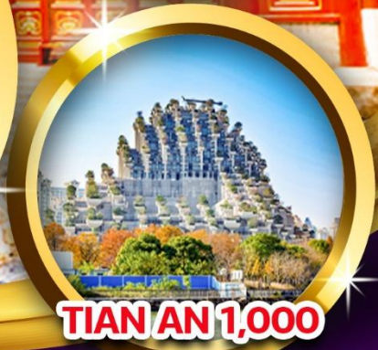
TIAN AN 1,000