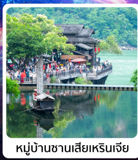
หมู่บ้านชาวน้ำเสี่ยเหรินเจีย