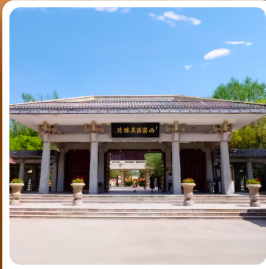
อุทยานประวัติศาสตร์จิวจวน