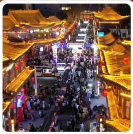
ตลาดจางเย่

ไฮไลท์! เขตท่องเที่ยวเกี่ยวเกี่ยวจิ่งจางหม่า ชมทุ่งหญ้าและภูเขาสวยแห่งกานซู ภูเขาสายรุ้งจางเย่ต้นเสี่ย "มหัศจรรย์ภูเขาสายรุ้งหลากสี"