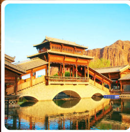
เมืองเล็กต้นเซียโซ่ว