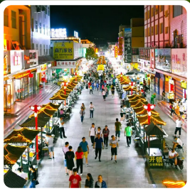
ตลาดกลางคืนซาโจว

อาหารมื้อพิเศษ ไก่ม้วนซอส ซีโรงหมูลัดลิ้นไก่