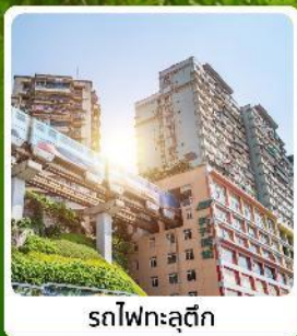
รถไฟฟ้าสุดึก