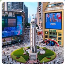
ถนนเจี๋ยฟางเป่ย์