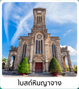
โบสถ์หินญาจาง