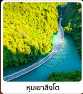
คุบเขาสิ่งโต

โอสลก! บินตรงลงเอินซือ เกี่ยวเอินซือเน่นจาดตีมท่วเมือง คุบเขาสิ่งโต ผังชานแกรนด์แคนยอน อุกยานจันลี้ชาน