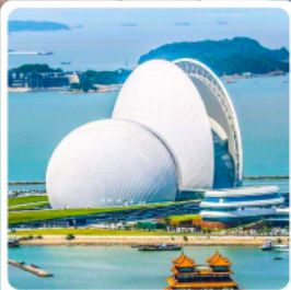
โรงละครไข่มุก