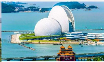
โรงละครไข่มุก