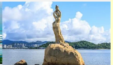
จูไห่ฟิชเชอร์เกิร์ล(หวีหนี่)

*ทางบริษัทฯ ขอสงวนสิทธิ์ในการสลับโปรแกรมทัวร์ตามความเหมาะสมขึ้นอยู่กับสถานการณ์หน้างาน โดยคำนึงถึงผลประโยชน์ของลูกค้าเป็นสำคัญ