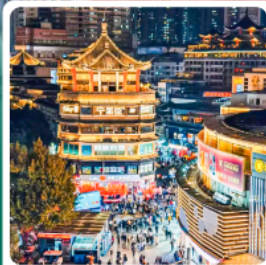
ตลาดตงเหมิน