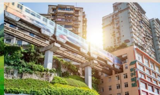
รถไฟฟ้าทะเลสาบ