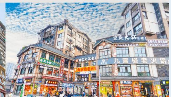
หมู่บ้านโบราณฉือซีโซ่ว

*ทางบริษัทฯ ขอสงวนสิทธิ์ในการสลับโปรแกรมทัวร์ตามความเหมาะสมขึ้นอยู่กับสถานการณ์หน้างาน โดยคำนึงถึงผลประโยชน์ของลูกค้าเป็นสำคัญ