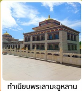
ทำเนียบพระลามะอุหลาน

• โฮเทล เป็นทรายเป็นชาวาน แหล่งท่องเที่ยวระดับ 5A ของจีน แกรนด์แคนยอนแม่น้ำเหลือง ชูปตาร์ท่ามกลางทะเลทราย