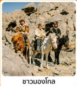
ชามองโกเลีย