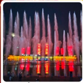
น้ำพุคังปาซี

• ไซโล่ เป็นทรายเสียงชาวนา แหล่งท่องเที่ยวระดับ 5A ของจีน ภูเขาไฟอุลันฮาตา น้ำพุคังปาซี น้ำพุที่สูงที่สุดในเอเชีย