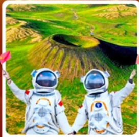
อุทยานภูเขาไฟอุลันฮาตา