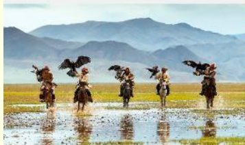
ชนเผ่ามองโกเลีย