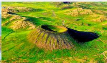
อุทยานภูเขาไฟอูลันฮาตา