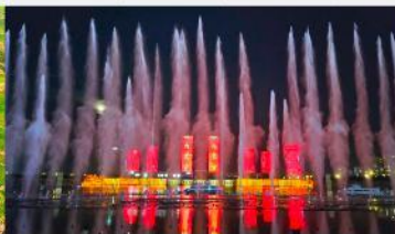
น้ำพุคังปาซี