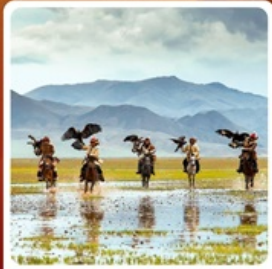
ชนเผ่ามองโกเลีย