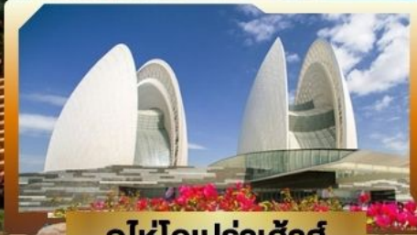
จุฬาลงกรณ์