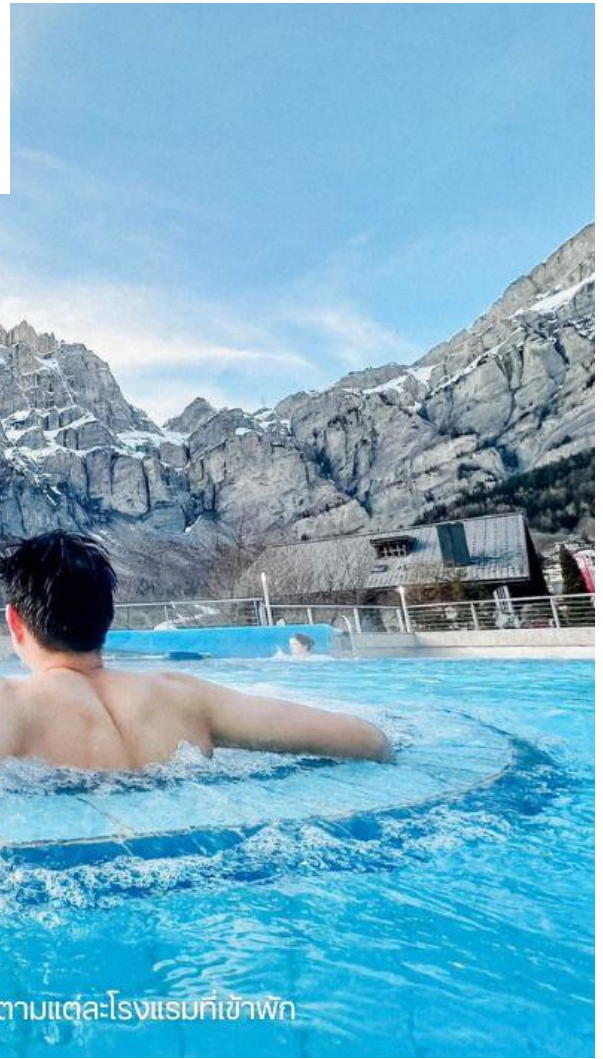
บรรยากาศของบ่อน้ำแร่ อาจจะไม่แตกต่างไปตามแต่ละโรงแรมที่เข้าพัก

บรรยากาศจริงจะมีความแตกต่างไปในแต่ละฤดูกาลท่องเที่ยว