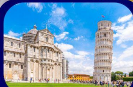
หอเอนแห่งเมืองปิซ่า

Special OFFER ฟรี !! ล่องเรือ Gondola เกาะเวนิส เมืองแห่งสายน้ำสุดโรแมนติก