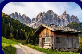
อุทยานฯ โดโลไมท์