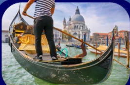
เที่ยวเกาะเวนิส