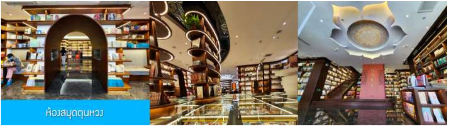
ห้องสมุดตุนหวง