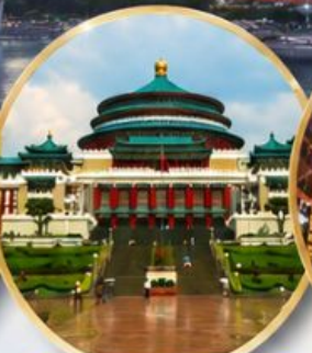
มหาศาลาประชาชน Great Hall of the People