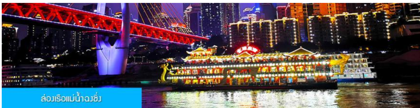
ล่องเรือแม่น้ำฉงชิ่ง