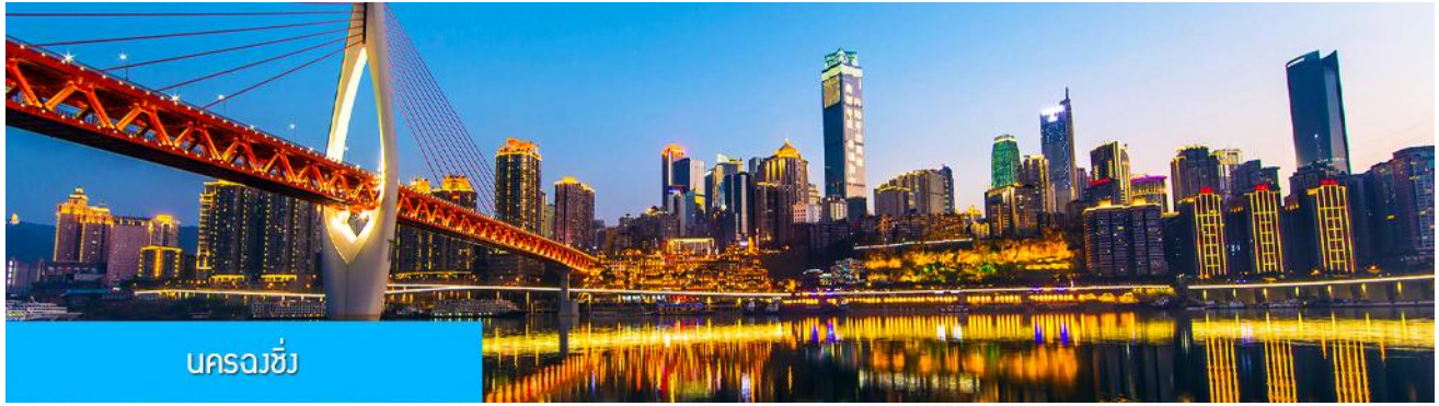
นครฉงชิ่ง