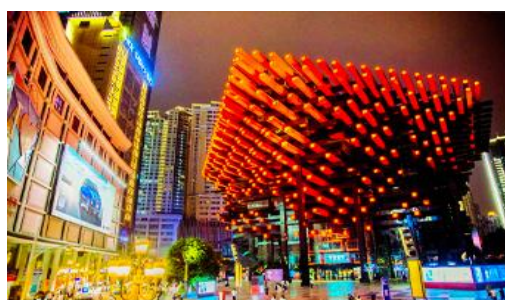
หอศิลป์กั๋วไท่

พักที่ HOLIDAY INN EXPRESS HOTEL โรงแรมระดับ 4 ดาวหรือเทียบเท่า เมืองฉงชิ่ง