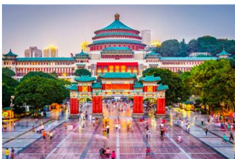
ศาลาประชาคม