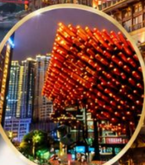
หอศิลป์กั๋วไท่ Guotai Arts Center