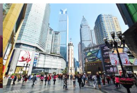
ย่านเจียวฟางเปย