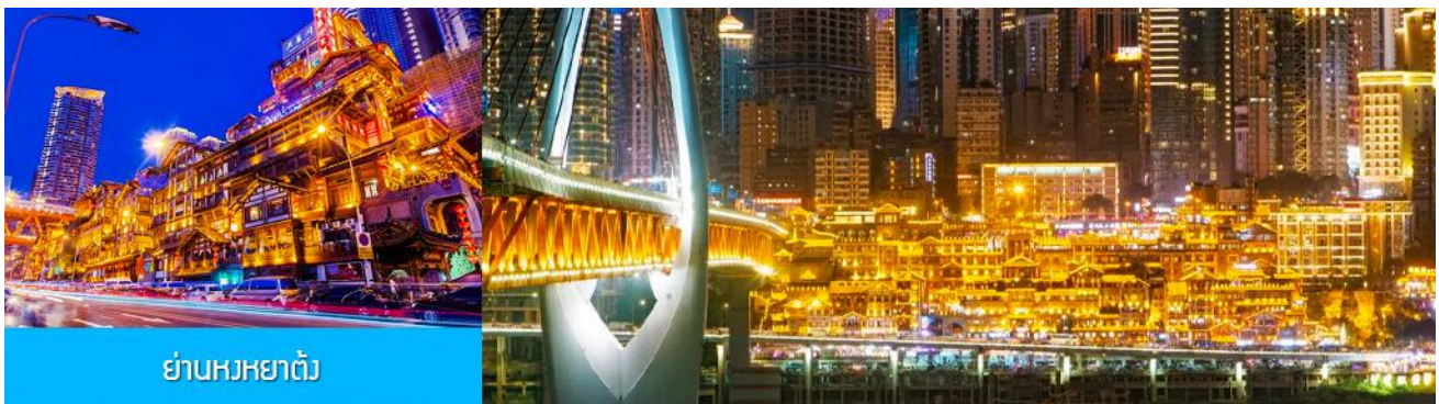
ย่านหงหยาดัง