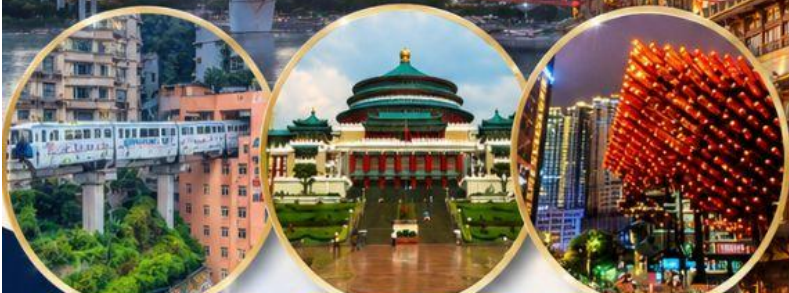
รถไฟทะลุตึก Liziba Station