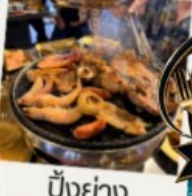
ปิ้งย่าง