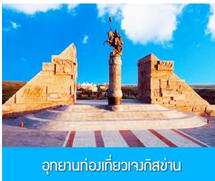
อุทยานก่อกว่ยเจกิสข่าน