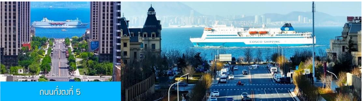
ถนนกว้างที่ 5

จากนั้นนำท่านเที่ยวชม สวนน้ำเมืองเวนิสตะวันออก 大连东方威尼斯城 เป็นเมืองเวนิสจำลองที่ถูกสร้างขึ้นด้วยทุนกว่า 8,000 ล้านบาท ออกแบบโดยบริษัท ARC จากประเทศฝรั่งเศส โดยจำลองผังเมืองเวนิสในประเทศอิตาลี บนพื้นที่กว่า 400,000 ตารางเมตร ประกอบด้วยคลองเวนิสและอาคารที่มีสถาปัตยกรรมแบบตะวันตกกว่า 200 หลัง มีบริการล่องเรือคอนโดล่าแก่นักท่องเที่ยว นำท่านเดินชม ถ่ายภาพที่ระลึกท่ามกลาง