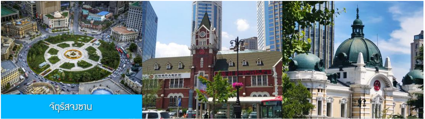
จัตุรัสสวน