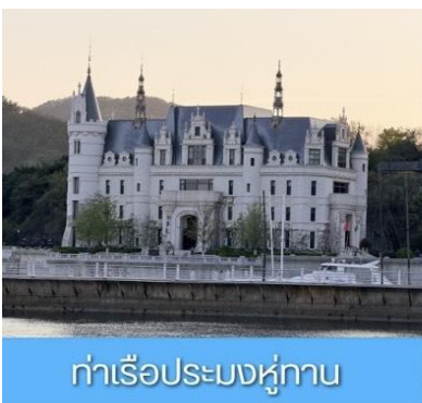
ท่าเรือประมงหู่กาน

พักที่ DALIAN JUZISHUIJING HOTEL หรือ โรงแรมระดับ 4 ดาวท้องถิ่น เมืองต้าเหลียน