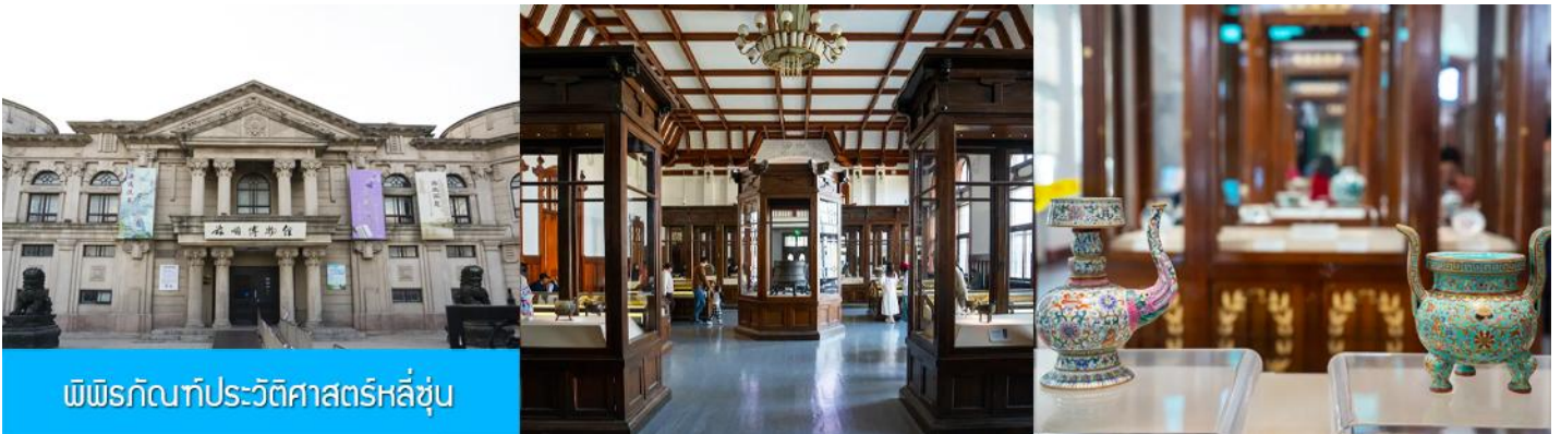
พิพิธภัณฑสถานประวัติศาสตร์หลี่ซุ่น

นำท่านเที่ยวชมและเก็บภาพ ณ สถานีรถไฟหลี่ซุ่น 旅顺火车站 เป็นสถานีปลายทางของเส้นทางรถไฟสาขา เส้นหยาง - ต้าเหลียน สร้างขึ้นในปีค.ศ. 1903 ออกแบบโดยสถาปนิกชาวรัสเซีย เป็นอาคารอิฐก่อปูนผสม โครงสร้างไม้ตามสถาปัตยกรรมรัสเซีย.