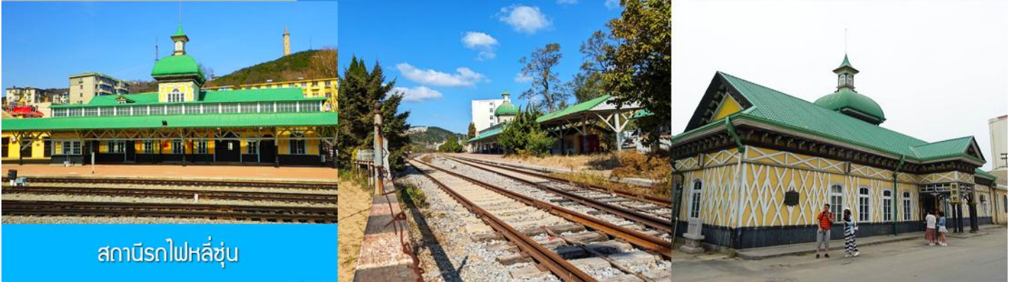
สถานีรถไฟหลี่ซุ่น

05.00 น. เรือท่องเที่ยว นำคณะเดินทางถึงท่าเรือเมืองต้าเหลียน นำท่านขึ้นรถบัสเพื่อเดินทางสู่ตัวเมืองต้าเหลียน เช้า รับประทานอาหารเช้า ณ ห้องอาหาร (7)