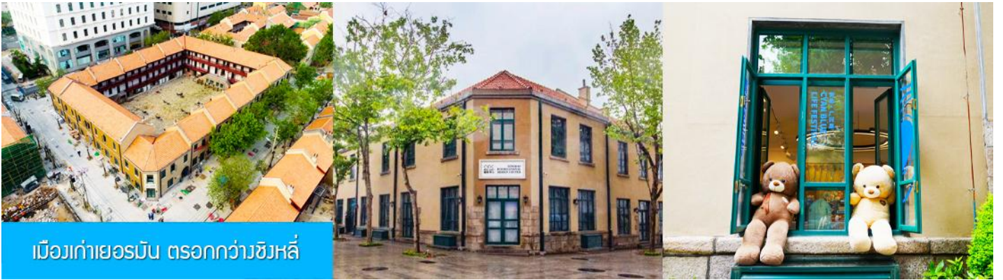
เมืองเก่าเยอรมัน ตรอกกว้างชิงลี่

จากนั้นเดินทางต่อ สู่ย่าน เมืองเก่าเยอรมัน ตรอกกว้างชิงลี่ 广兴里 ตรอกซอกซอยที่เรียงรายไปด้วยอาคารสถาปัตยกรรมแบบ ผสมผสานจีนและอาคารสไตล์ยุโรป