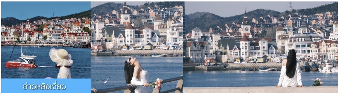
อ่าวหลังเจี้ยว

หลังอาหารเช้านำท่าน เที่ยวชม ท่าเรือประมงหมู่ทาน 大连渔人码头 เป็นจุดเช็คอินที่โดดเด่นด้วยสถาปัตยกรรม สไตล์ยุโรปสีสันสดใส ผสมผสานกลิ่นอายเมืองท่าดั้งเดิมเข้ากับบรรยากาศสุด โรแมนติกที่เต็มไปด้วยเรือประมง คาเฟ่ ร้านอาหาร และจุดชมวิวยุริรมทะเล