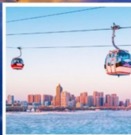
นั่งกระเช้าชมแม่น้ำซงฮวาเจียง