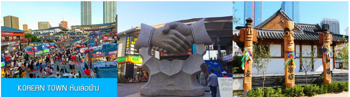
KOREAN TOWN หันเล่อฝาง