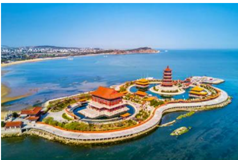
อุทยานทงเทียวแปดเซียนข้ามทะเล