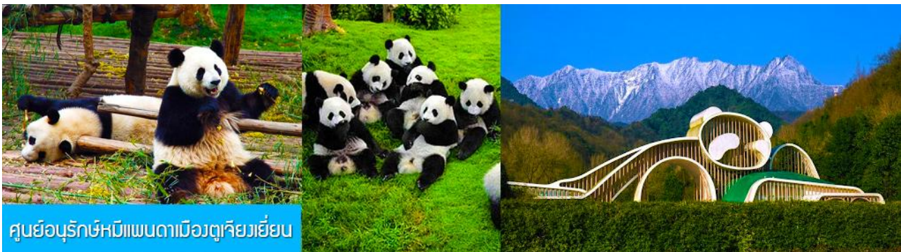
ศูนย์อนุรักษ์หมีแพนดาเมืองตู่เจียงเย็น