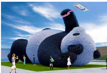
ตุ๊กตาแพนด้าบนเซลฟี

หลังอาหารนำท่านเดินทางสู่ เมืองตูเจียงเยียน 都江堰 (ระยะทาง 234 กม. ใช้เวลาเดินทางราว 4 ชั่วโมง) ระหว่างเดินทางท่านสามารถชมทัศนียภาพธรรมชาติอันงดงามของสองข้างถนนขณะที่รถแล่นผ่าน ที่มีทั้งภูเขาหิมะสูง หุบเขา ธารน้ำ และทุ่งหญ้าบนที่ราบสูง หรือพักผ่อนตามอัธยาศัยบนรถระหว่างเดินทาง