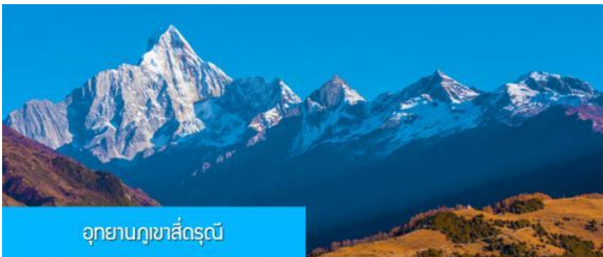
อุทยานกุเจาสีตรุณี