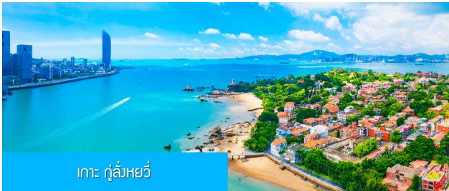
เกาะ กู่ล้งหยวี