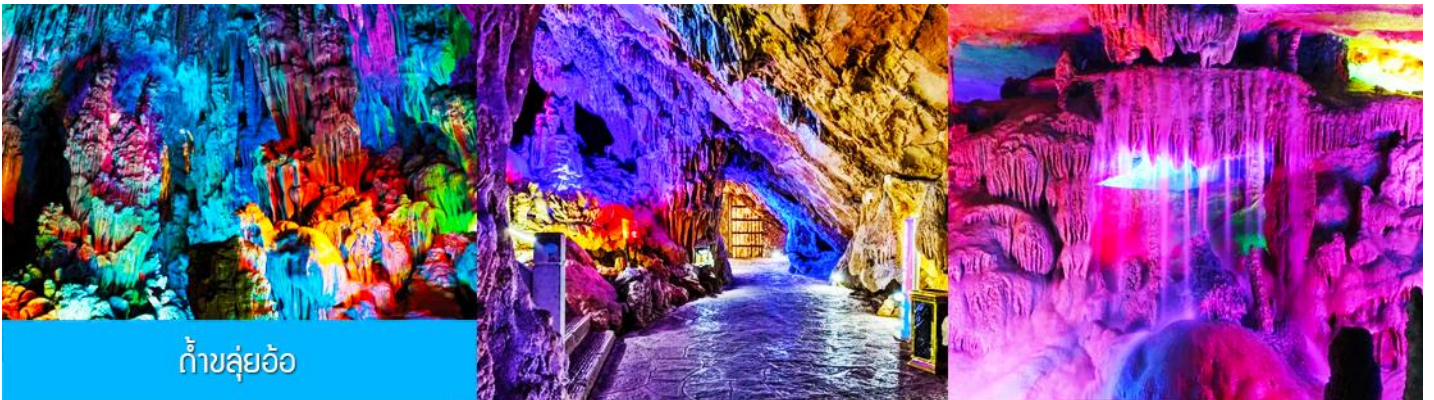
ถ้ำลู่อ้อ

พักที่ VIENNA INTER HOTEL ระดับ 4 ดาวท้องถิ่นหรือเทียบเท่าในเมืองกุ้ยหลิน