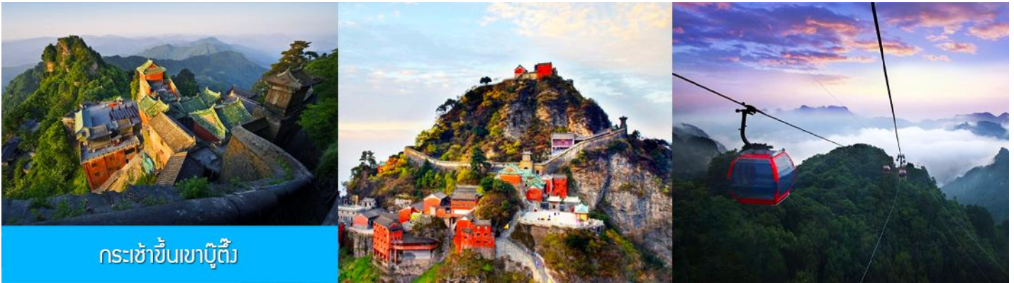
กระเช้าขึ้นเขาบู๊ต้ง

พักที่ WUDANGSHAN HOTEL ระดับ 4 ดาวห้องดีนหรือเทียบเท่าในตำบลเขาบู๊ต้ง