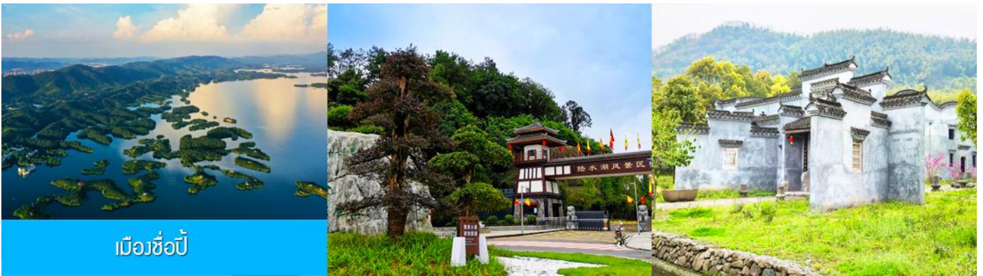
เมืองซื่อปี้

เที่ยง รับประทานอาหารกลางวัน ณ ภัตตาคาร (8)