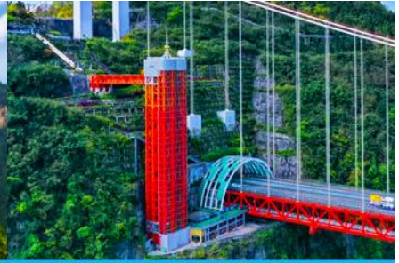
ลิฟท์แก้วอุทยานไร่จ้าย