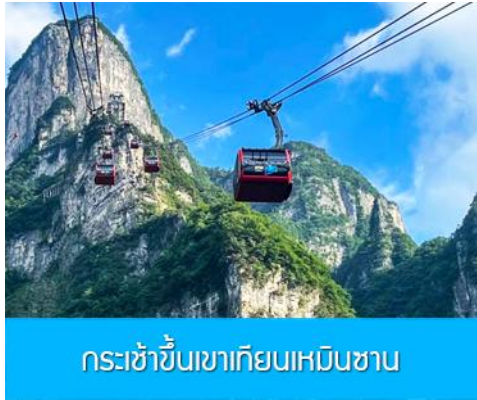
กระเช้าขึ้นเขาเทียนเหมินซาน

พักที่ HANTING HOTEL ระดับ 4 ดาวท้องถิ่นหรือเทียบเท่าในเมืองจางเจียเจี๋ย