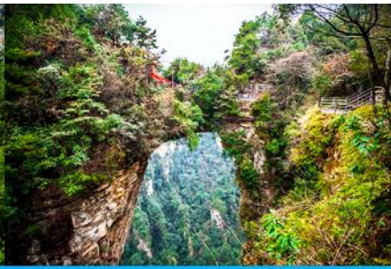
สะพานหนึ่งในไต้หล้า