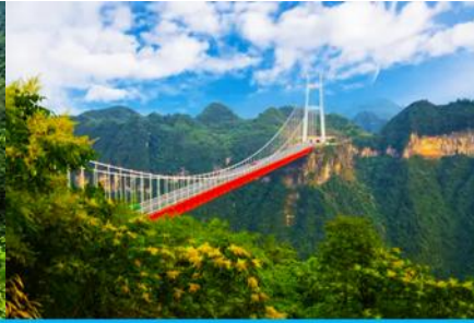
สะพาน ไร่จ้ายต้าเฉียว