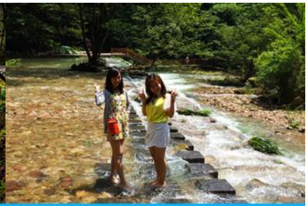
ลำธารจินเปียนซี