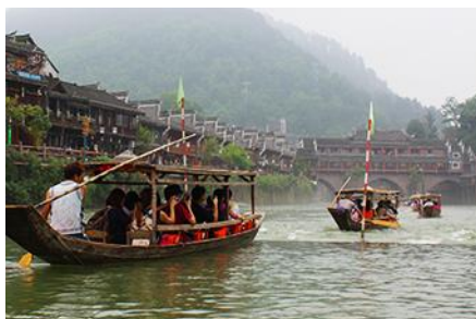
ล่องเรือแม่น้ำถั่วเจียง

หมายเหตุ การเดินทางเข้าเมืองโบราณฟ่งหวง ต้องนั่งรถเมล์ของเมืองโบราณ ท่านจำเป็นต้องหิ้วกระเป๋าสัมภาระของท่านขึ้น-ลงรถเมล์ด้วยตัวท่านเอง เพราะรถบัสทัวร์เราไม่สามารถเข้าไปในเมืองโบราณได้ จอดส่ง ณ จุดขนส่งของเมืองโบราณเท่านั้น เมื่อเดินทางถึงเมืองโบราณฟ่งหวงแล้ว นำท่านเช็คอิน ณ โรงแรมที่พัก(อยู่ในเมืองโบราณใกล้แหล่งท่องเที่ยว)