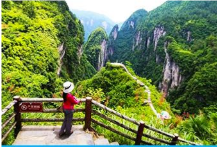
แท่น ปูฉาสวรรค์

พักที่ ZUIXIANGXI HOTEL ระดับ 4 ดาวท้องถิ่นหรือเทียบเท่าในเมืองโบราณฟงหวง