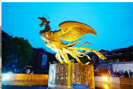
จัตุรัสหงส์