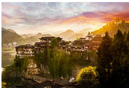
เมืองโบราณ ฝูหรงเจิน