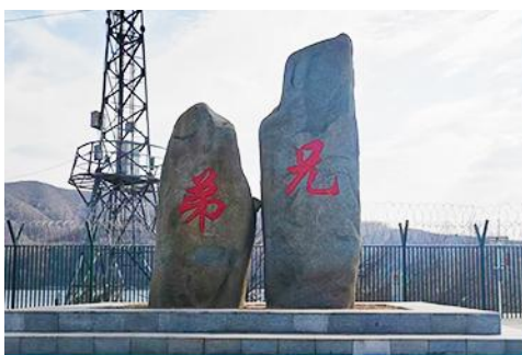
ป้ายพรมแดนจีนเกาหลีและแท่งศิลาสองพี่น้อง