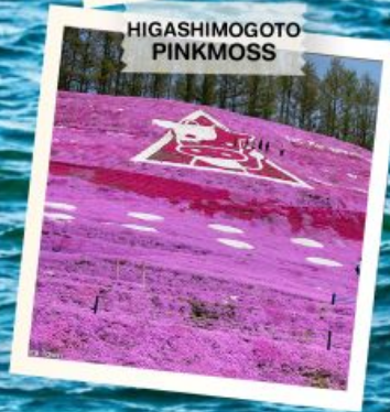
HIGASHIMO GOTO PINKMOSS