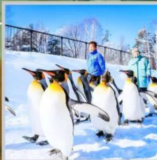
"PENGUIN ASAHİYAMA ZOO"