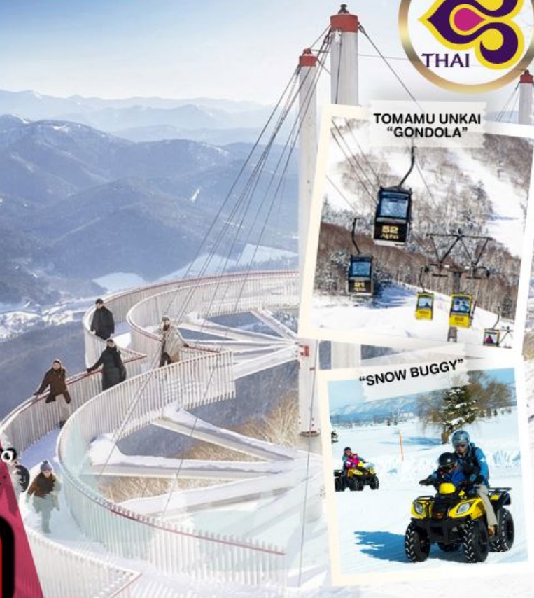
TOMAMU UNKAI "GONDOLA"