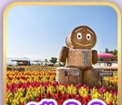
สวนซิกิโซโนะโอะกะ