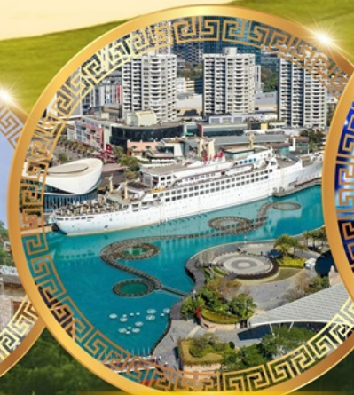
ท่าเรือ Sea World