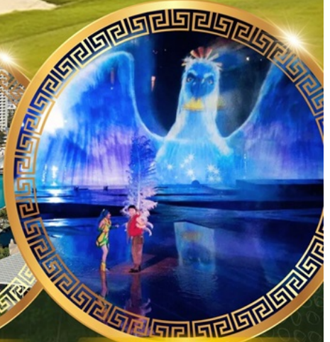
การแสดงม่านน้ำ