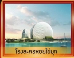
โรงละครหอยไข่มุก