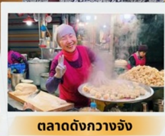
ตลาดดังกวางจ้ง