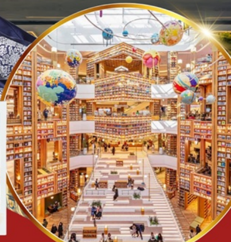
ห้องสมุด สตาร์ฟิลด์ ซูวอน