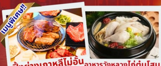
ปิ้งย่างเกาหลีไม่อื่น อาหารวังหลวงไก่ตุ๋นโสม