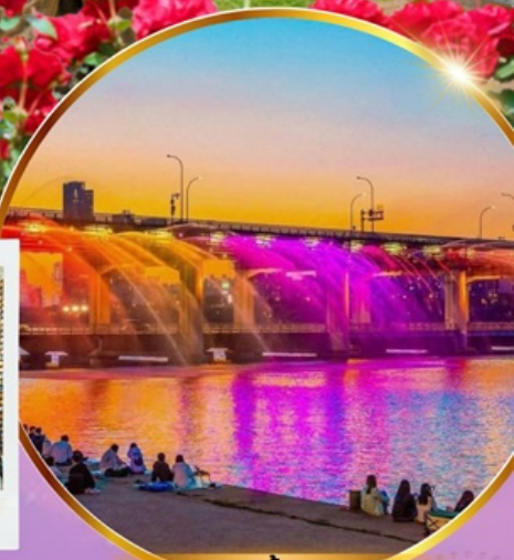
ชมสะพานน้ำพุสายรุ้ง