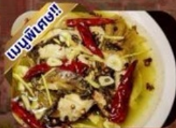
ปลาต้มพริกทอด