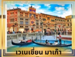
เวเนเซียน มาเก๊า