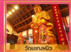
วัดเขงหมิว