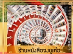
ร้านหนังสือจงซูเก๋