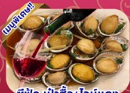
ซีฟู้ด เป้าอ้อ+ไวน์แดง