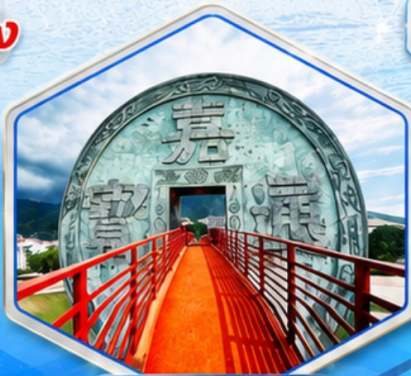
จตุรัสเหรียญโบราณ