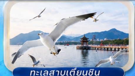
ทะเลสาบเตียนชาน